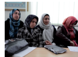
Le operatrici che hanno seguito il corso al DOWA