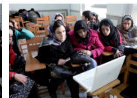
Durante una lezione, le ragazze osservano il montaggio di un video