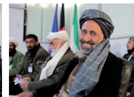
Uno degli insegnanti partecipanti al corso