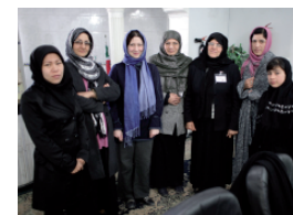
Una foto di gruppo con le donne che hanno partecipato al corso

L'Università Cattolica del Sacro Cuore ha condotto diverse attività di supporto alle donne afgane. Tra queste, il corso di formazione per operatori e operatrici del DOWA (Department of Women Affairs) che lavoreranno in un centro di ascolto e accoglienza delle donne vittime di violenza.